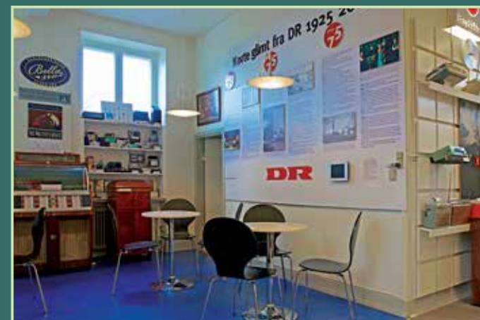
Vores café har en original Jensen-jukebox fra 1956.